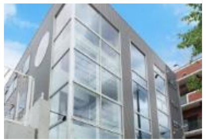
髪も身体も美しく輝く Musée 本店