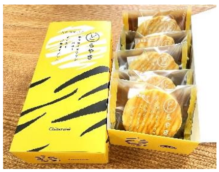
箱のデザインは予告なく変更される場合があります